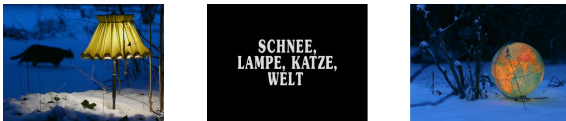
Abb. 6-8: Schnee, Lampe, Katze, Welt 38

Gesellschaft war – irritierend wirkt diese Montage der filmischen Dokumentation des banal anmutenden Abrisses im Zeitraffer mit ungewöhnlicher Musik und vor allem die eingefügte Zeichnung von King-Kong. Kluges Essay läuft Gefahr, geltende Regeln des Anstandes mit Blick auf die Opfer zu verletzen (zumindest jedoch die Darstellungskonventionen zu 9/11, die geradezu ikonisch die Live-Aufnahmen des Terrorakts aktualisieren).