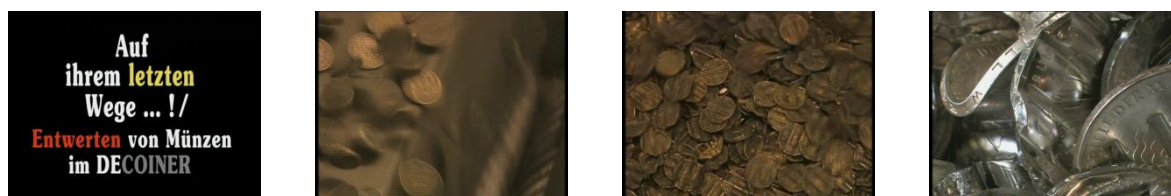
Abb. 9-12: »Auf ihrem letzten Wege!« Entwertung von Münzen im Decoiner 39

Ein Insert mit der Aufschrift Schnee, Lampe, Katze, Welt (in der Mitte eines Clips von ca. einer Minute Länge) verrät Titel und Inhalt des zweiten ausgewählten Essays von Kluge. Gezeigt wird hier ein geradezu surrealistisches Arrangement: eine elektrische Stehlampe erhellt den Vordergrund einer verschneiten Gartenlandschaft, eine Katze huscht im dunklen Hintergrund vorbei und nach dem Insert erscheint dann im Schnee ein erleuchteter Globus, der Rezipienten den indischen Subkontinent darbietet. Musikalisch begleitet wird dies alles, eine Geschichte , in der diese Welt die Gesellschaft ersetzt, durch eine verspielte Komposition für Klavier, die einer rätselhaften Atmosphäre Geltung verschafft.