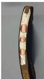
Untersuchung auf Korrosion

Die Trinkwasserleitung in der Anklamer Straße ist eine GG-Druckleitung aus den 1880ern, welche in DN 450 bzw. DN 375 verlegt wurde. Teilstücke wurden auf Korrosion hin untersucht. Zusammen mit einer Schadensrate von 0,08 Schäden \text{km}^{-1} \text{a}^{-1} wird der Zustand der Leitung mit sehr gut bewertet. Jedoch entspricht sie nichtmehr dem Stand der Technik, da auf ihr Hausanschlüsse liegen. Es empfiehlt sich die Verlegung einer separaten Versorgungsleitung für die Hausanschlüsse.