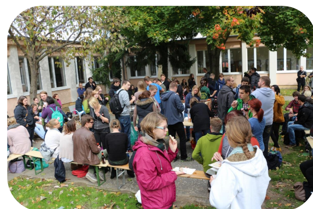
Grillen der Erstsemesterler

Treffpunkt: Justus-von-Liebig-Weg am Hörsaal JLW8-HSL