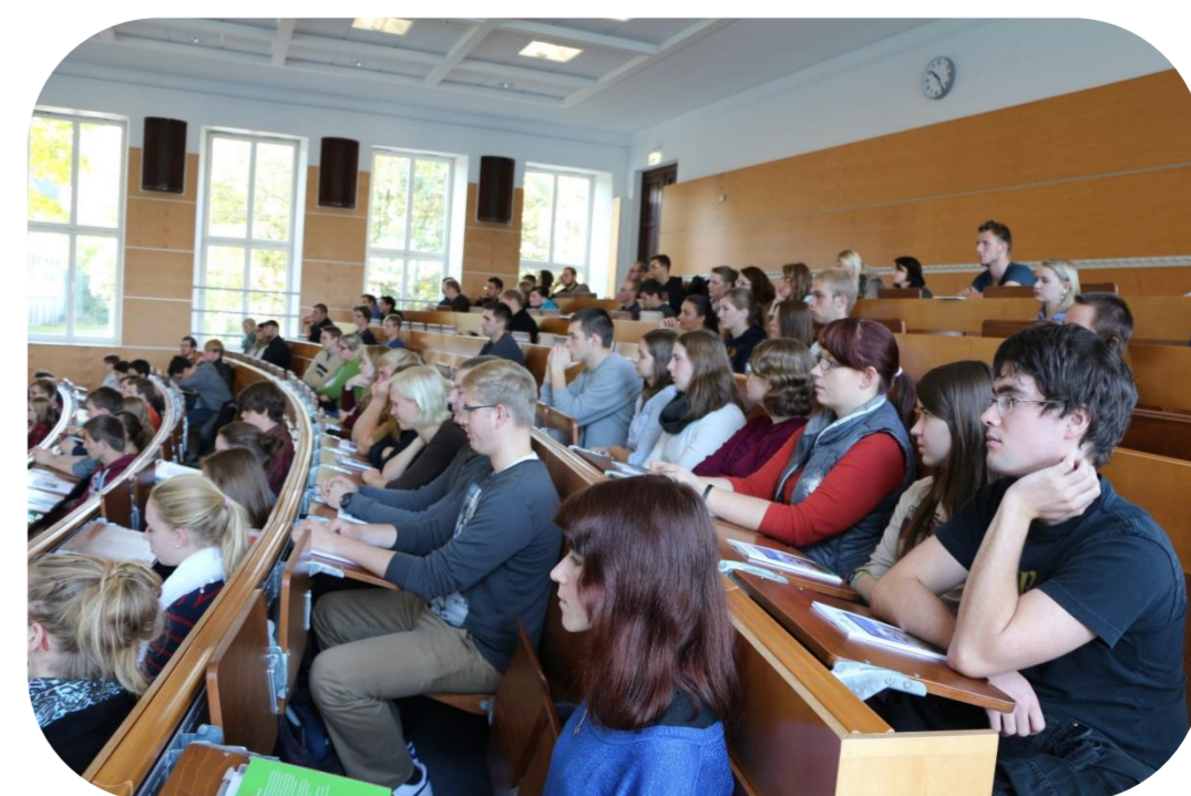
im Hörsaal, JLW8-HSL